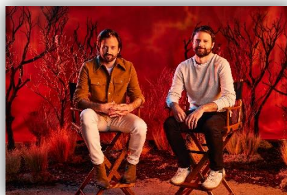
1. Matt i Ross Dufferowie - reżyserowie serialu.

Prawie każdy z was słyszał już o Stranger Things . Serial łączący fantastyczne, sceny akcji i trochę horroru przyciągnął do siebie widzów. Jego premiera miała miejsce 15 lipca 2016 roku na Netflix. Reżyserowie serialu, Matt i Ross Dufferowie chcieli klimat popkultury amerykańskiej lat 80., nawiązując przy tym m.in. Stevena Spielberga, Johna Carpentera, czy Stephena Muszę przyznać, że udało im się to. Serial zyskał bardzo