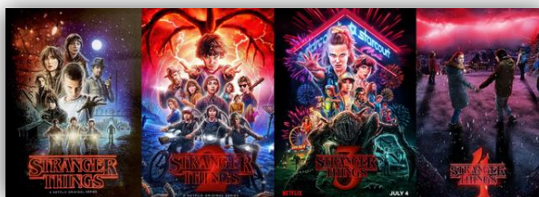
3. Plakaty promujące poszczególne sezony.

Sezon numer cztery, który został wydany w częściach w maju oraz lipcu 2022 roku, miał odzew ze strony widzów. Dzięki niemu jeden piosenkarki Kate Bush „Running Up That” został wykorzystany w produkcji Netflix, po 37 latach znalazł się na szczytach list na całym świecie. Zapowiedziany już piąty Stranger Things , który niestety został jako ostatni, jest wyczekiwany przez fanów, ze względu na niewyjaśnione wątki z sezonu czwartego. Scenarzyści już zaczęli pisać skrypty, a także podzielili się z widzami tytułem pierwszego odcinka, który brzmi „The Crawl”. Osobiście, bardzo oczekuję na niego i mam nadzieję, że będzie również tak świetny, jak pozostałe.