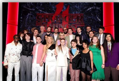
2. Główna obsada serialu wraz z twórcami.

Do tej pory powstały 4 sezony tego światowego hitu. Akcja pierwszego sezonu rozpoczyna się w drugiej połowie 1983 roku. W nocy 6 listopada, w spokojnym miasteczku Hawkins, położonym w stanie Indiana w dziwnych okolicznościach znika Will Byers (Noah Schnapp). Jego matka od razu zaczyna poszukiwania swojego ukochanego syna. W tym sezonie, pojawia się również dziewczyna z nadprzyrodzonymi mocami, którą główni bohaterowie tacy jak Mike (Finn Wolfhard), Dustin (Gaten Matarazzo) czy Lucas (Caleb McLaughlin) nazywają – „Nastka” (Millie Bobby Brown), która zdaje się posiadać jakieś wieści na temat, gdzie jest młody chłopak. Mieszkańcy Hawkins za wszelką cenę starają się szukać